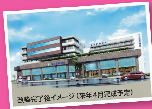
改築完了後イメージ (来年4月完成予定)

将来看護職を希望している方や、現在看護職に就かれている方。 (年齢・在学・在職等一切問いません)