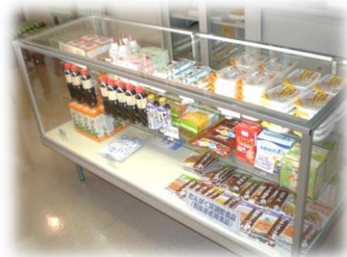
【治療用特殊食品の紹介・販売】