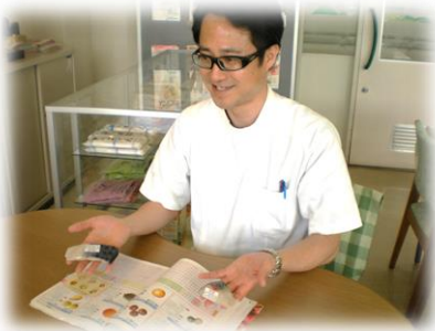
【外来・入院個別指導】

◆個別指導は予約制で、外来・入院患者様を対象に行なっています。個々の疾病、体格、年齢に応じて、食事、生活習慣に対するアドバイスを行なっています。また、入院中の患者様で、栄養状態が悪い方、食事摂取量の少ない方は管理栄養士が直接ベッドサイドへお伺いし、個々の状態に合わせた個別対応も行っています。