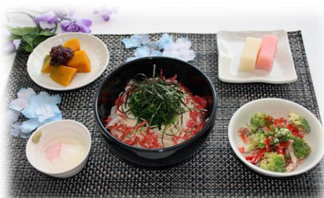
【出来上がりのメニュー】